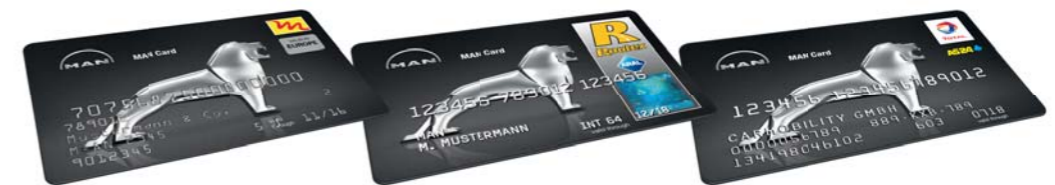
MAN Card TOTAL

Wir sind für Sie da und sprechen Ihre Sprache – europaweit!