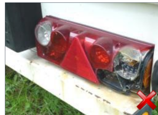
Berechnungsart: Erneuerung (100%)