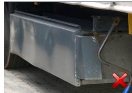
Berechnungsart: Erneuerung (100%)