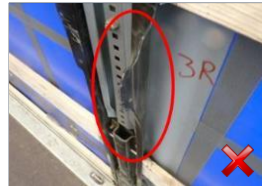
Berechnungsart: Erneuerung (100%)