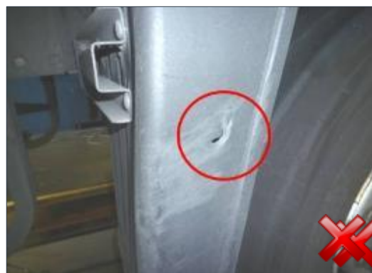
Berechnungsart: Erneuerung (anteilig) Funktionalität ist gewährleistet