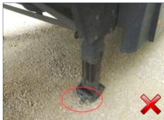
Berechnungsart: Erneuerung Teilersatz (100%)