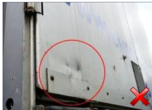
Berechnungsart: Instandsetzung (anteilig nach Laufzeit)