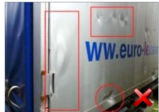
Berechnungsart: Erneuerung (100%)