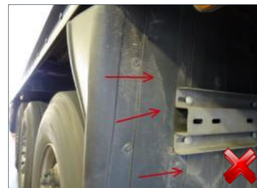
Berechnungsart: Erneuerung (100%)