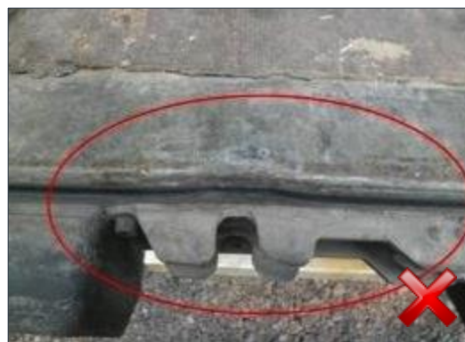
Berechnungsart: Instandsetzung (anteilig nach Laufzeit)