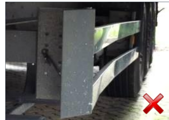
Berechnungsart: Erneuerung (100%)