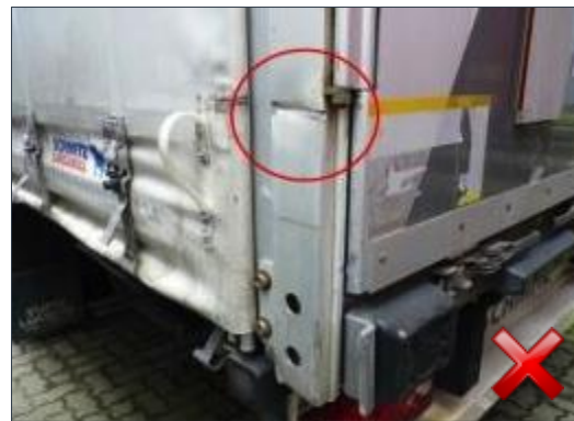
Berechnungsart: Instandsetzung (anteilig nach Laufzeit)