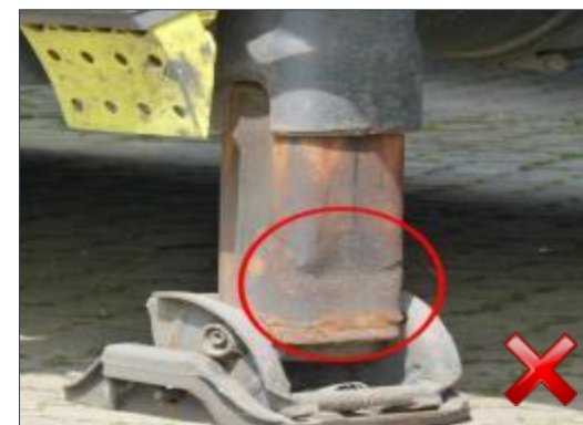
Berechnungsart: Erneuerung (100%)