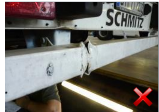
Berechnungsart: Erneuerung (100%)