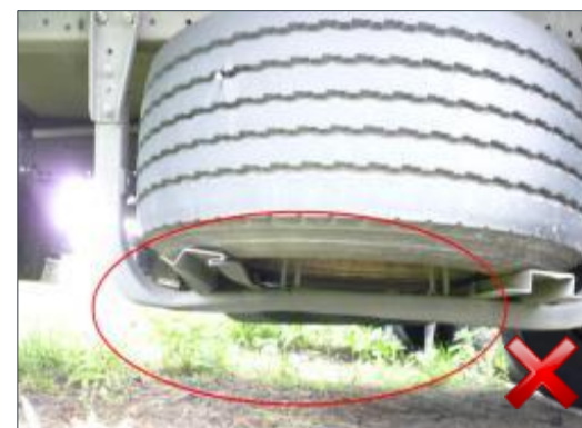
Berechnungsart: Erneuerung (100%)