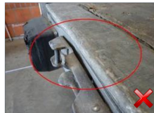
Berechnungsart: Instandsetzung (anteilig nach Laufzeit)