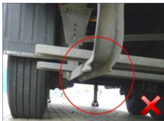
Berechnungsart: Erneuerung Teilersatz (100%)