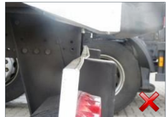
Berechnungsart: Erneuerung (100%)