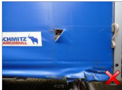
Berechnungsart: Instandsetzung (anteilig nach Laufzeit)