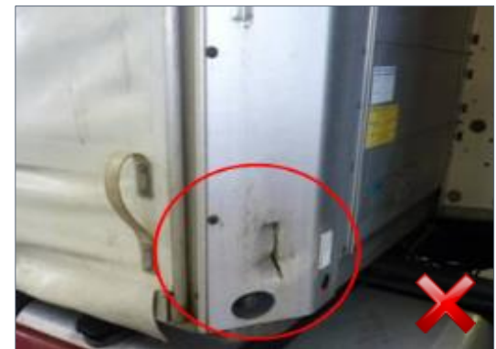
Berechnungsart: Erneuerung (100%)