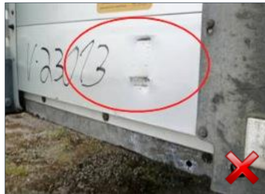
Berechnungsart: Instandsetzung (anteilig nach Laufzeit)