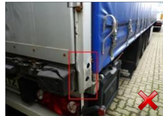
Berechnungsart: Erneuerung (100%)