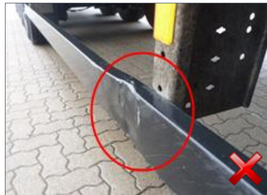
Berechnungsart: Erneuerung Teilersatz (100%)