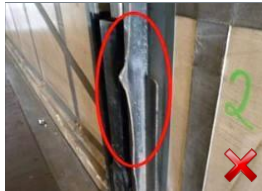
Berechnungsart: Instandsetzung (anteilig nach Laufzeit)