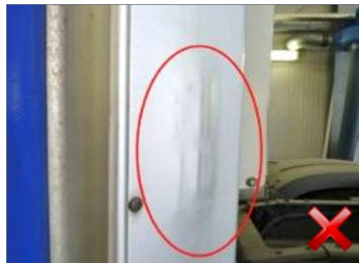
Berechnungsart: Instandsetzung (anteilig nach Laufzeit)