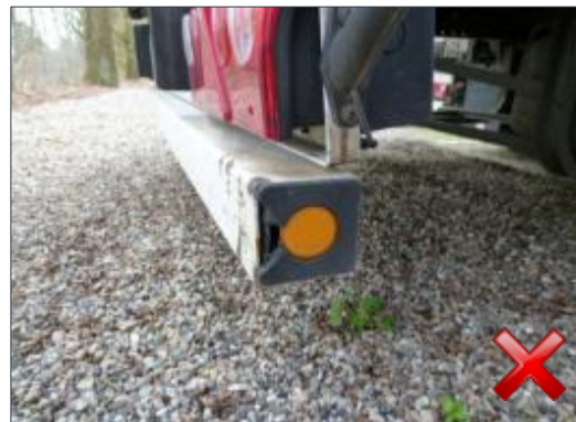
Berechnungsart: Instandsetzung (anteilig nach Laufzeit)