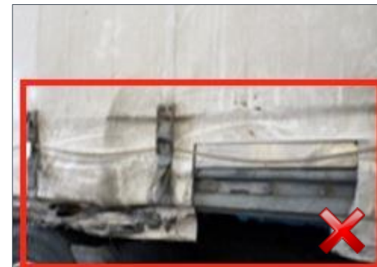
Berechnungsart: Erneuerung Teilersatz (100%)