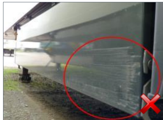
Berechnungsart: Instandsetzung (anteilig nach Laufzeit)