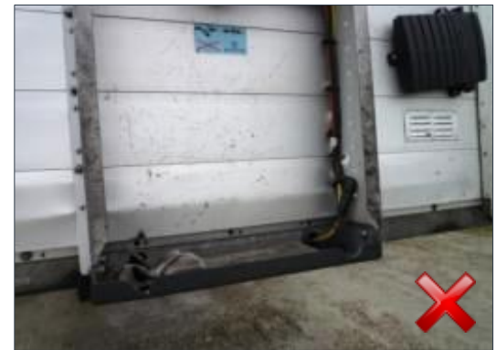
Berechnungsart: Erneuerung Teilersatz (100%)